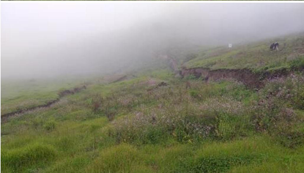
Imágenes 2, 3 y 4: Imágenes de las grietas en el sector La Pampa.15/02/2022