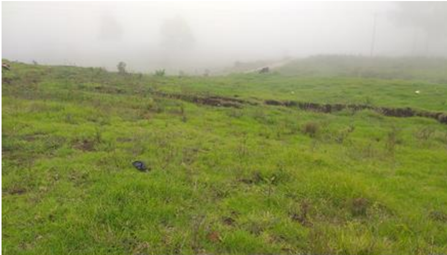
Imagen 5: Imagen de una grieta en el sector La Pampa.15/02/2022 Vía de acceso a La Gallera