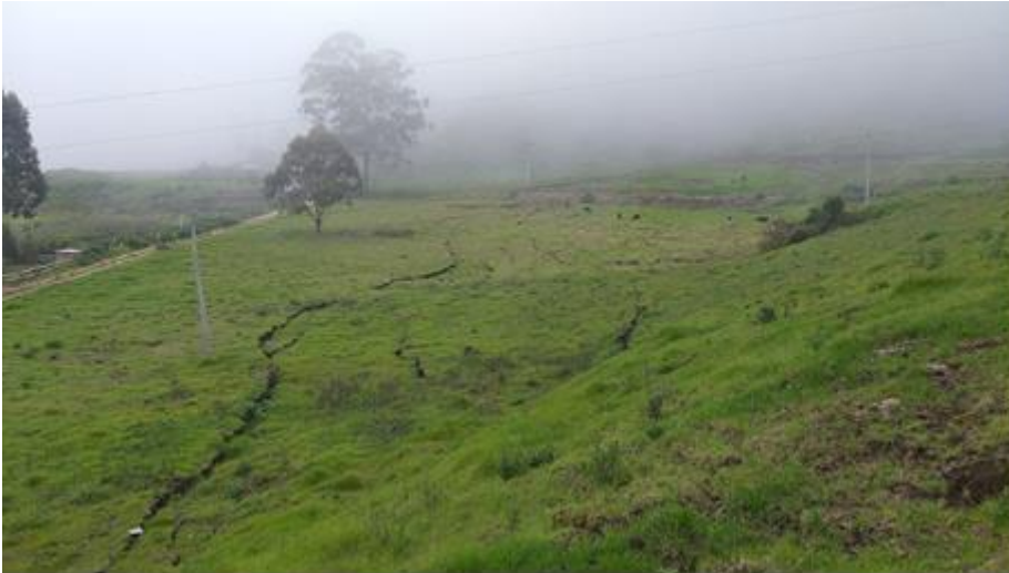
Imagen 10: panorámica de las grietas en dirección sur de La Pampa.15/02/2022