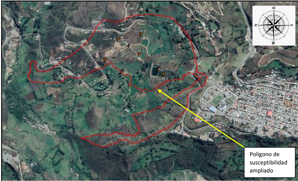
Imagen 1: Ubicación espacial del sitio del deslizamiento con referencia a Chunchi