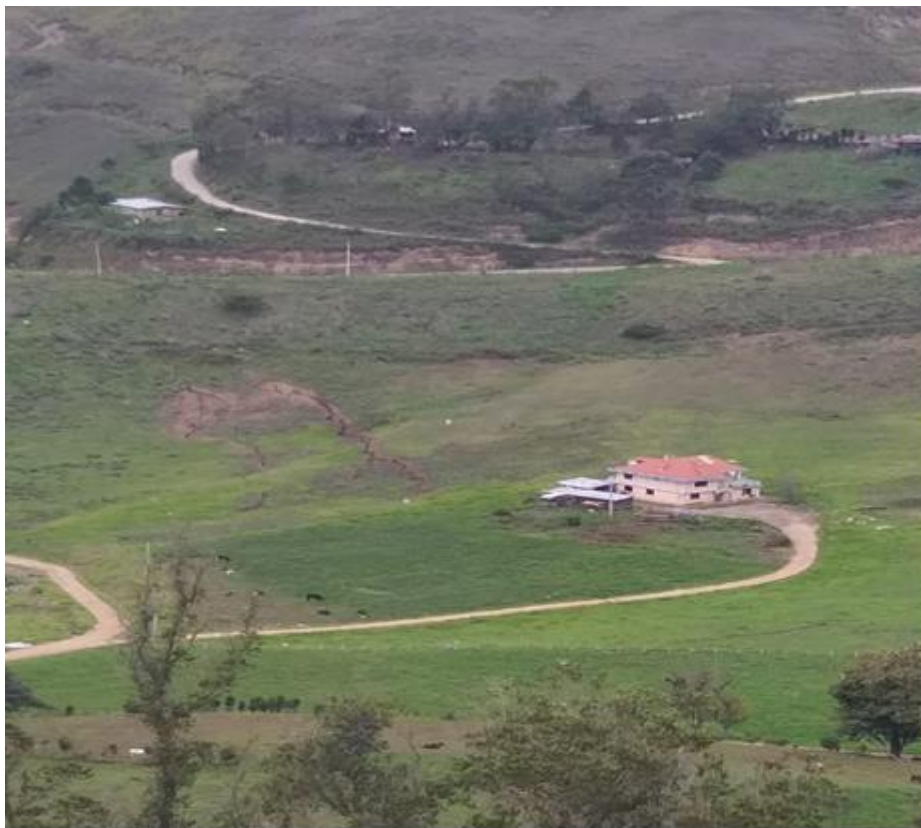
Imagen 1: Sector La Pampa 21/12/2021

Se coordina con el director de Obras Públicas del Gad de Chunchi y se realiza el recorrido por el sector de La Pampa, sitio en el que se verifican el aparecimiento e incremento de los espesores de las grietas.