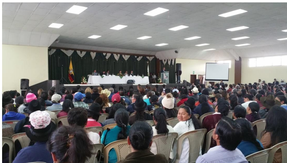
Sesión Inaugural Administración Municipal 2019 - 2023

Se adoptó un total de 129 resoluciones, entre ellas: 6 reformas del presupuesto del GAD Municipal del año 2019 (2 reformas por la administración anterior) y la aprobación del presupuesto del GAD Municipal correspondiente al año 2020.