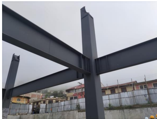
Figura 5: Vigas de acero.

En la imagen no se pudo evidenciar defectos en los puntos de suelda, esto quiere decir que no se reconocen imperfecciones en la forma del grano, hendiduras, porosidades o fisuras. Esto puede deberse al control de calidad de las soldaduras en obra. Los ensayos realizados para las soldaduras fueron por tinta penetrante, información que se puede corroborar específicamente en la PLANILLA DE AVANCE DE OBRA 3, donde se llega a concluir que las soldaduras inspeccionadas por muestreo, se encuentran libres de defectos