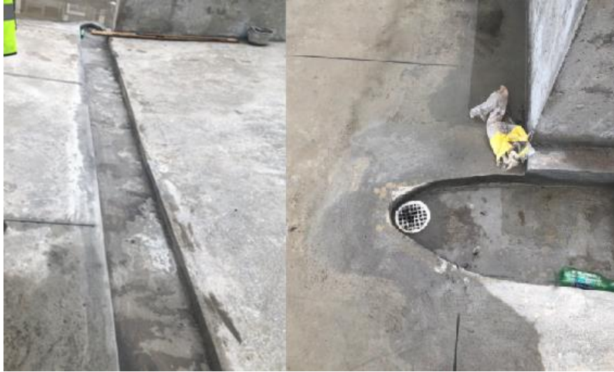
Figura 6: Rejilla de recolección en rampa.

Al momento de la visita en campo a la obra, se visualiza que en el contrapiso existe acumulación de agua, siendo esta la preocupación principal de los miembros de veeduría ciudadana. Como se verificó en los planos de diseño, no existen sumideros en la planta N- 4.00 m que es la planta actualmente construida y donde se genera el problema.