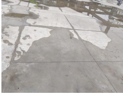
Figura 3: Contrapiso

Al observar la parte superficial del contrapiso no se pudo evidenciar patología alguna, pero se puede apreciar cortes longitudinales y transversales muy bien definidos separados entre unos y otros una distancia aproximada de 2.00m, esto se pudo haber realizado con la finalidad de controlar la fisuración del contrapiso producto la contracción que puede presentar el hormigón.