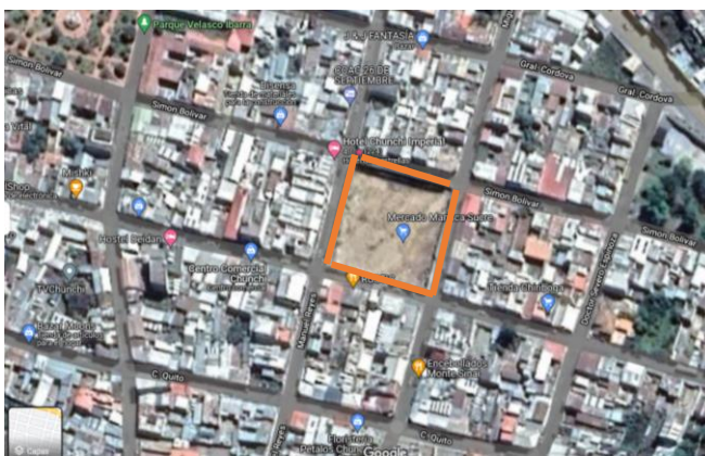
Figura 1: Ubicación del Mercado Plana Mariscal Sucre, Google earth