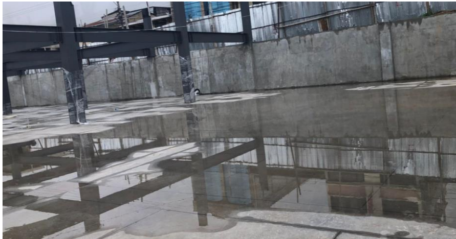
Figura 7: Acumulación de agua en contrapiso.

Al momento de la visita en campo a la obra, se visualiza que en el contrapiso existe acumulación de agua, siendo esta la preocupación principal de los miembros de veeduría ciudadana. Como se verificó en los planos de diseño, no existen sumideros en la planta N- 4.00 m que es la planta actualmente construida y donde se genera el problema.