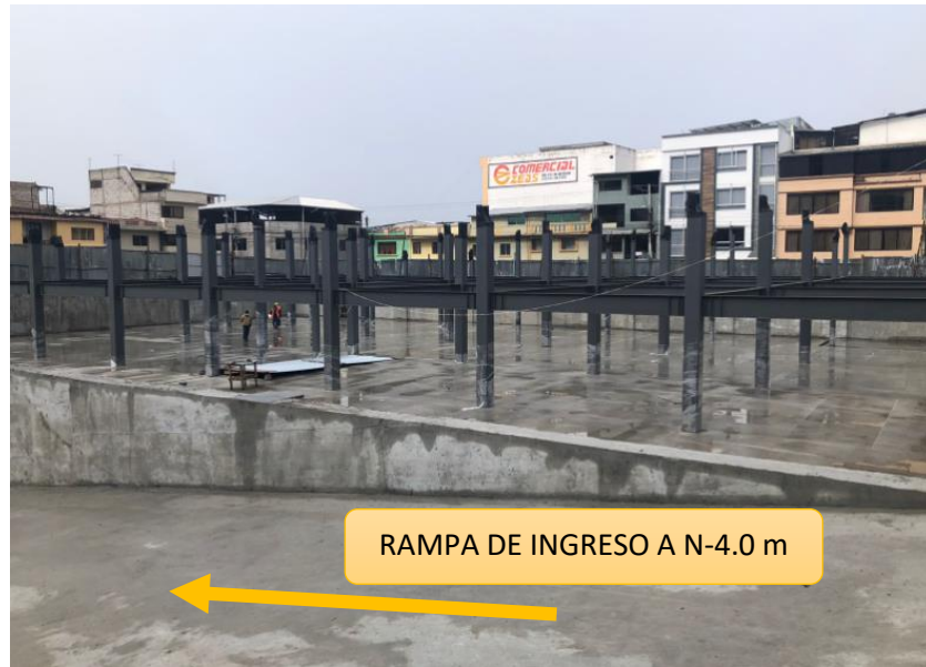
Figura 8: Rampa de ingreso a subsuelo

El nivel N-4.00 m construido servirá como parqueadero de la Plaza en construcción, no existen aparatos sanitarios ni puntos de agua en este nivel, por lo que se presume que no se han contemplado sumideros en el subsuelo. No se justifica que en el algún momento se pueda tener un evento extraordinario donde llegue a ingresar agua por la rampa o por cualquier otro lado y llegue a inundar este nivel de parqueaderos.