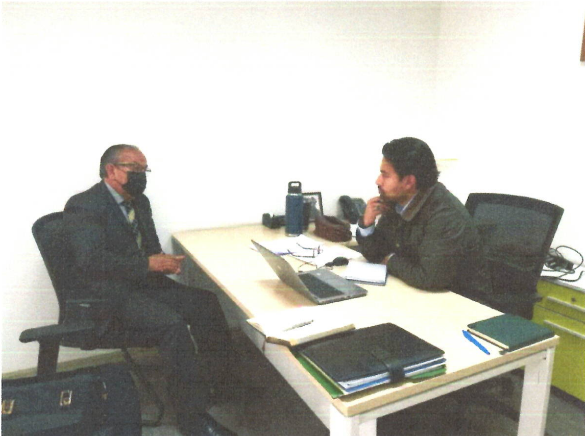
REUNIÓN EN EL MAG Ministerio de Agricultura y Ganadería