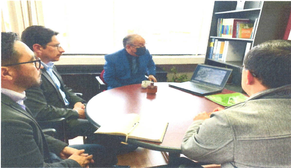
REUNIÓN CON LOS FUNCIONARIOS DE AME