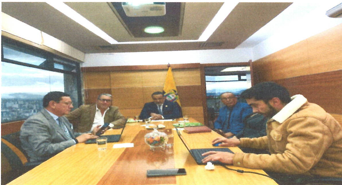
REUNION CON EL MINISTRO DEL MTOP